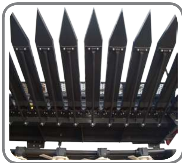
Trays • Поддоны