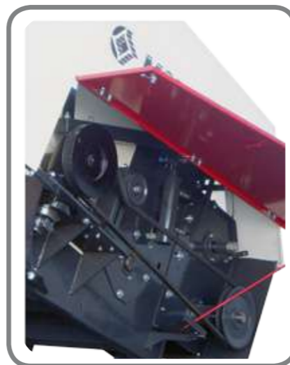
Box of blades • Режущий аппарат