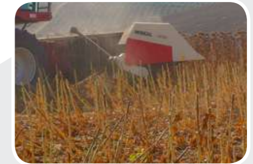
Harvest without stalk Chopper Сбор урожая без стеблеизмельчителя