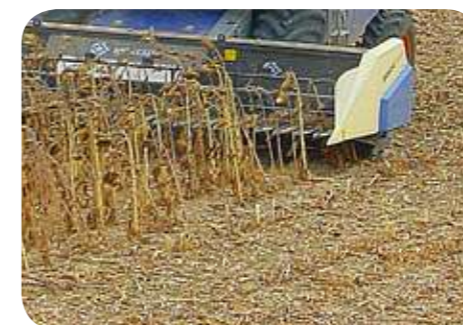
Harvest with stalk Chopper Сбор урожая со стеблеизмельчителем

Индикативные модели. Возможно исполнение в любом размере. Вес модели без стеблеизмельчителя